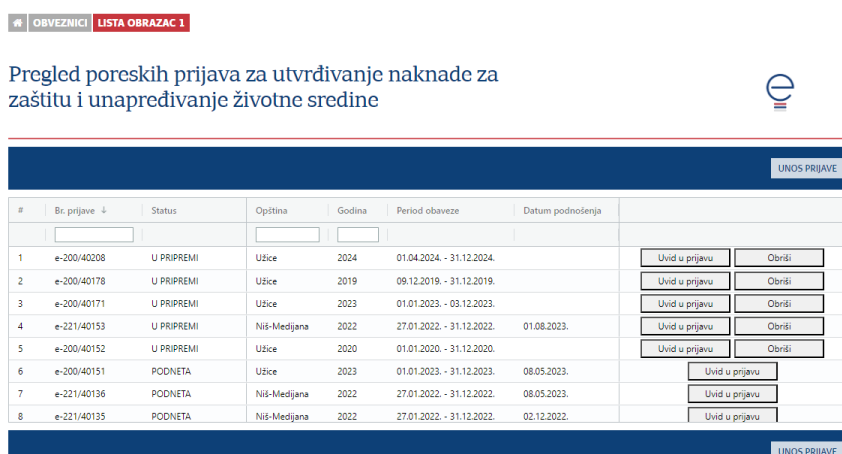
Slika br. 3: Pregled prijava

Po izboru ovlašćenja, korisniku se prikazuje lista već kreiranih i podnetih prijava (slika br. 3). Uvid u podatke već evidentiranih prijava moguć je preko akcije „Uvid u prijavu“.